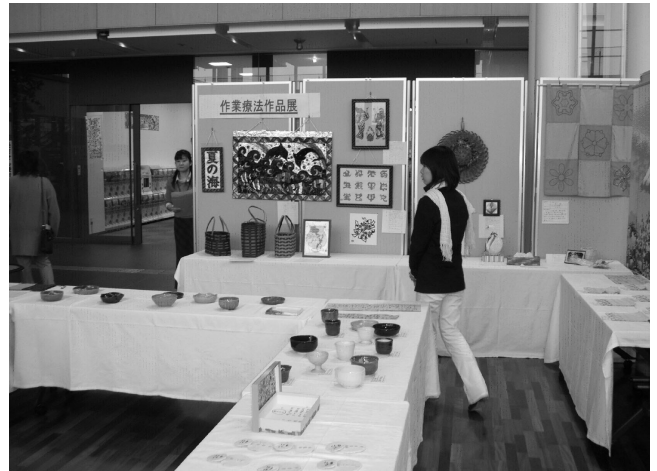
図1 作業療法作品展

福祉用具に関する相談をはじめ、作業療法士になるための養成過程に関する進路相談などを受け付けた。終了までに15件の相談があり、最も多かったのが進路・就職に関する相談で12件、他に自助具取扱業者についての相談、デイケア実施事業所の所在に